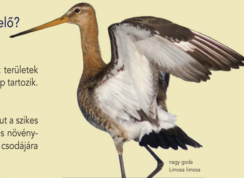
nagy goda Limosa limosa

A szikes gyepek szép példája a Tószegi-legelő is. Ide kötődő fajok például a sziki üröm, bárányparj, vékonyka útifű, heverő seprűfű, pozsgás zsásza és a védett kisészű aszat, valamint a nagy tűzlepke, vöröshasú unka, nagy goda.