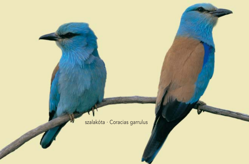
szalakóta - Coracias garrulus