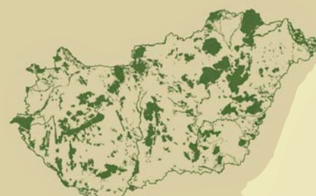
A magyarországi Natura 2000 hálózat