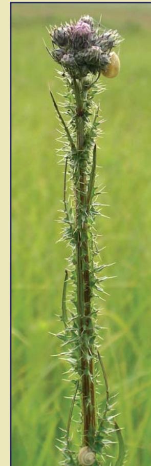
kisfészű aszat - Cirsium brachycephalum