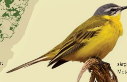
sárga billegető Motacilla flava