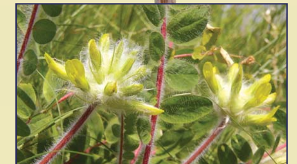
gyapjas csüdfű Astragalus dasyanthus

A tátorjánon kívül más ritka, védett növények is menedéket találnak ezen a gyepe-szigeten, így például a gyapjas csüdfű, kései pitypang, borzas len. A virággazdag, tarka szárazgyepek számos különleges állatfaj számára is az utolsó menedéket jelentik a szántók sivatagában. Itt él például a keleti pókszöcske és a délvidéki poszméh.