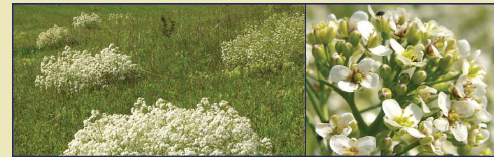
tátorján - Crambe tataria

Az eurázsiai erdőssztyep zóna jellemző és igen értékes élőhelytípusát, a löszgyepet képviseli. Az Alföldön korábban kiterjedt, ma már töredékes löszpuszták számos értékes fajt őriznek. Egyikük a hazánkban nagyon megritkult, fokozottan védett, a nemzetközi Vörös Listán is szereplő tátorján. A hazai tátorján-állomány fele, hozzávetőlegesen négyszáz virágzó tő a Leányvári völgyrendszerben él.