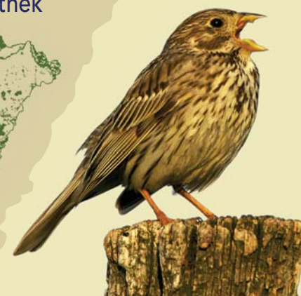
sordély - Miliaria calandra