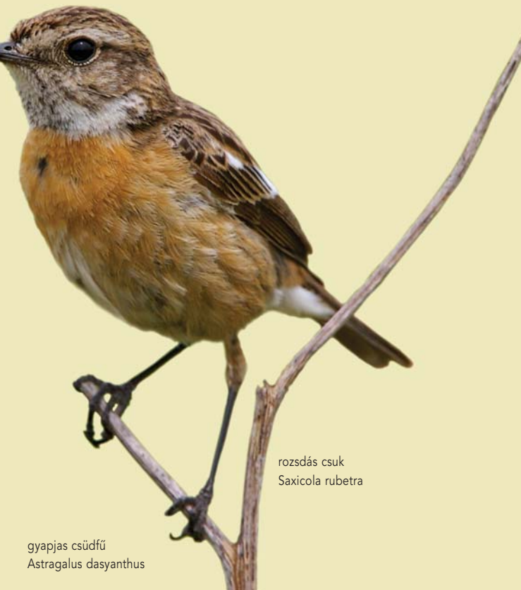
rozsdás csuk Saxicola rubetra