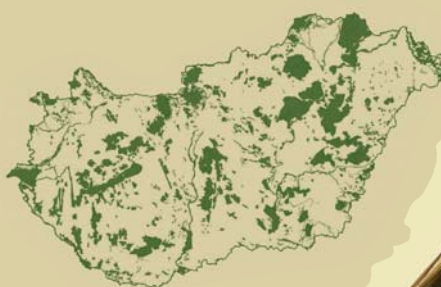
A magyarországi Natura 2000 hálózat