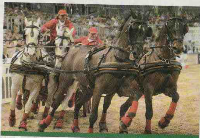
Parádés program várható